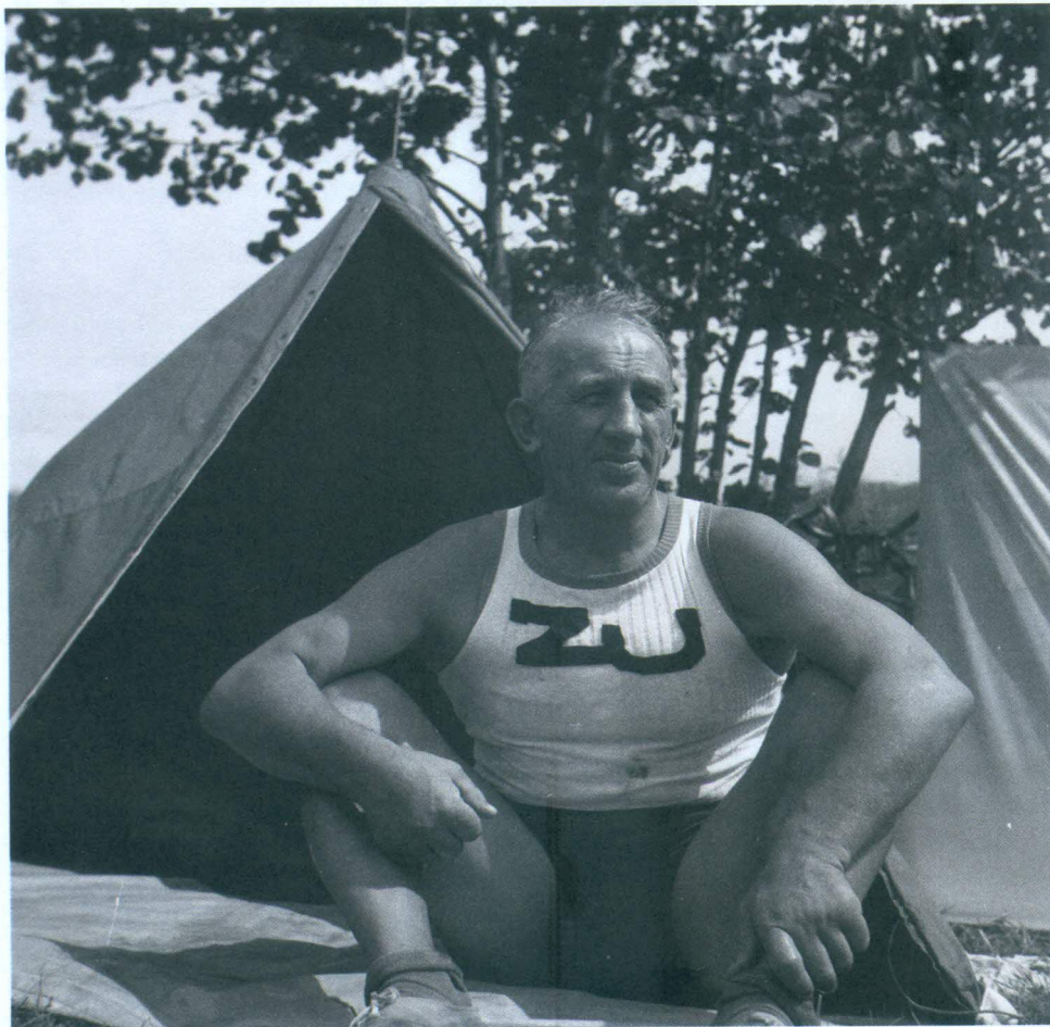
V dresu trampského sportovního klubu Zlaté údolí.

Byl všestranným sportovcem a olympionikem, který pro mládež založil sportovní ranč v Lukách pod Medníkem, obchodníkem, trampem a propagátorem zdravého a aktivního stylu života, který na vlastní kůži poznal dějinné veletoce minulého století.