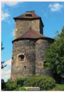
Hrad Týnec na Sázavou

Pátý ročník Součástí je výstava „Byl na Sázavě přívoz“ Výstava knih, fotografií, pražských zpravodajů a dalších dokumentů spojených s tvorbou Jana Morávka www.mestotynec.cz/muzeum/ Vstup zdarma, dobrovolné příspěvky na začátku programu vítány