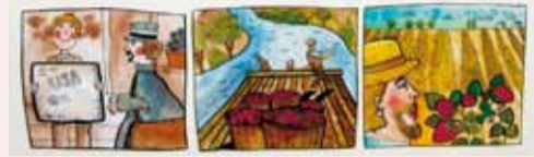
Ukázka z chystaného komiksu, autorka Magdalena Timplová

Muzeum Netvořice Vernisáž v pátek 22. 5. 2015 v 17.00 h. Projekt žáků ZŠ Netvořice, kteří budou sami realizovat rozhovory s pamětníky jahodářství na Netvořicku. Pokud si zpracovat i krátký filmový dokument o zdejším jahodáři